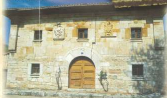
Casona de Los Fierro

La ruta continúa por las calles de Cármenes, donde se puede admirar la arquitectura rural, marcada por la sencillez y la funcionalidad, referentes de su doble uso como vivienda y cuadra para el ganado.