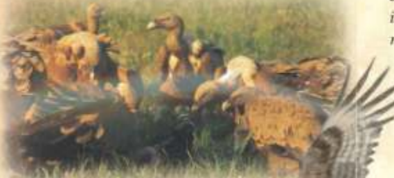
Buitres en una carroña

El buitre es la mayor rapaz que surca los cielos de Cármenes. Aunque anida en las cercanas colonias de Vegacervera y el valle del Torío busca en estos valles altos del Torío las reses muertas que constituyen su principal fuente de alimentación. Los buitres en pocos días pueden hacer desaparecer del campo un animal del tamaño de una oveja o mayor, evitan de esta forma que las enfermedades puedan propagarse con facilidad a la fauna salvaje y a la cabaña ganadera. En la actualidad se encuentra en expansión.